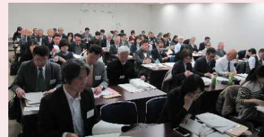
平成29年2月団体向け研修会の様子