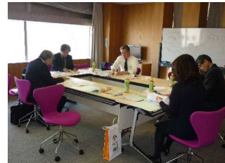
三重県PTA安全互助会 税理士を交えた会計経理 の研修会の様子